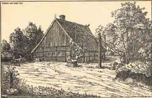
„Lasse Hoes“ op den Biekerboit, bij Ootmarsum.